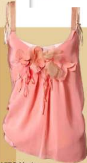
FLATTERHAFT Seidentop mit Blüten und zarten Trägern. Susanne Bommer, 239 Euro

MUST HAVE Hier passt alles fürs Wochenende rein! Traumhaft weiche XL-Bag in Batik-Optik. Strenesse Blü, 399 Euro